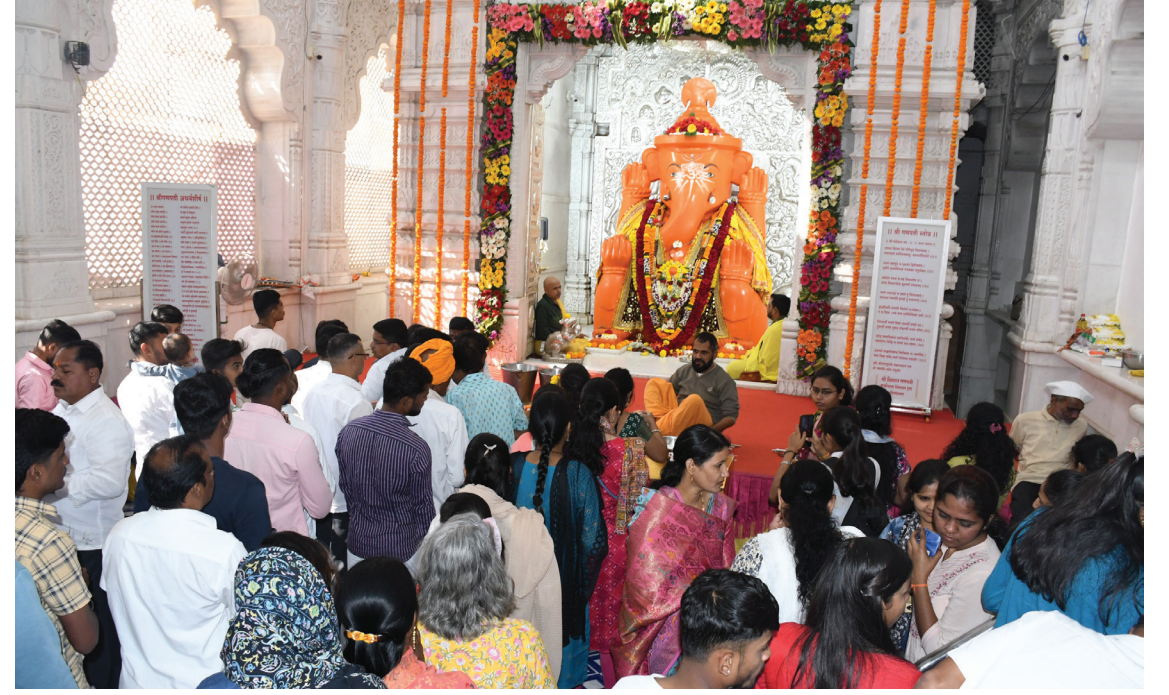
नववर्षानिमित्त ग्रामदैवत श्री विशाल गणेश मंदिर येथे भाविकांनी सकाळपासून दर्शनासाठी मोठी गर्दी केली होती.